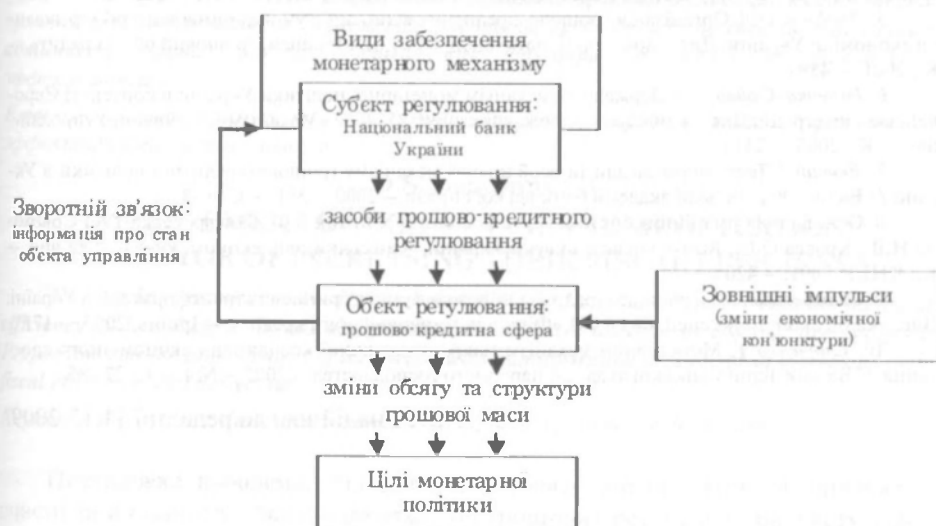
Рис. 3. Структура грошово-кредитного механізму в Україні, авторська розробка

Узагальнивши досліджені вище матеріали, слід зазначити, що грошово-кредитний механізм — це система взаємопов'язаних елементів, яка складається з комплексу правового, інформаційного, програмно-технічного, методологічного забезпечення, що визначає особливості використання монетарних засобів центральним банком країни у процесі регулювання грошово-кредитної сфери для реалізації загальноекономічних цілей, актуальних у визначений історичний період.